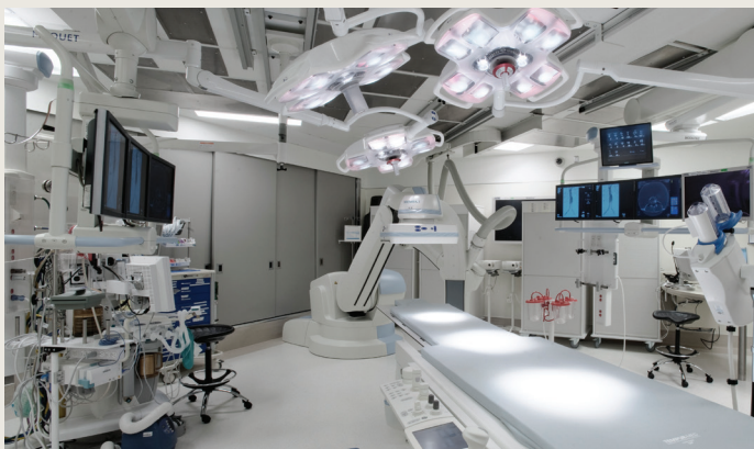
西门子 (Artis Zeego)