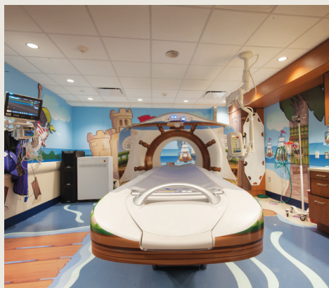
儿科低剂量 CT 扫描套件

操作设施 —— 医院的操作设施包括配备供复杂手术病例使用的西门子 (Artis Zeego) 系统的手术室。该系统提供以透视为基础的血管内超声进行全身成像的功能，带来无与伦比的精确水平以及彻底诊断和干预。